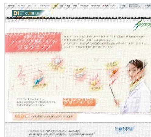
タイアップサイト★